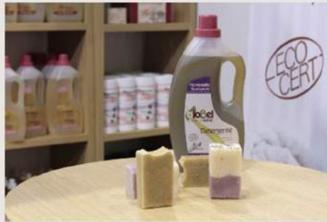
Jabones y detergentes con certificación ecológica.

¿El uso de detergentes convencionales puede tener consecuencias negativas sobre nuestra salud? Los detergentes convencionales contienen en sus fórmulas una serie de ingredientes que pueden causar diferentes tipos de problemas para la salud. Estar expuestos a estos ingredientes de manera directa, a la hora de poner la lavadora, e indirecta, a través de los residuos que quedan en los tejidos después del lavado. Todo ello nos puede causar enfermedades en la piel como la dermatitis irritante, enfermedades ambientales como la sensibilidad química múltiple o fibromialgia. Por último y más preocupante en 2013 la OMS catalogó a los alquilfenoles y nonilfenoles que se usan en la fabricación de tenso-activos utilizados en la fabricación de detergentes convencionales como disruptores endocrinos. Estas sustancias están relacionadas directamente con enfermedades del sistema endocrino como diabetes, obesidad, malformaciones e incluso cierto tipo de cánceres hormono dependientes: de mama, ovario, endometrio, próstata, testículo y tiroides.